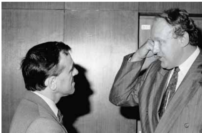
Federální ministr vnitra Richard Sacher v rozhovoru s předsedou „vlády národního porozumění“ Mariánem Čalfou.

O týden později, 12. ledna 1990, zastavil Sacher svým rozkazem definitivně činnost tzv. vnitřního zpravodajství Státní bezpečnosti, to jest příslušných operativních odborů a oddělení Hlavní správy kontrarozvědky Sboru národní bezpečnosti (II. správa SNB), správy kontrarozvědky SNB v Bratislavě (XII. správa), správ Státní bezpečnosti v krajích i jejich podřízených okresních či obvodních organizačních celků. Ke dni účinnosti rozkazu měla být zrušena funkční místa příslušníků poli-