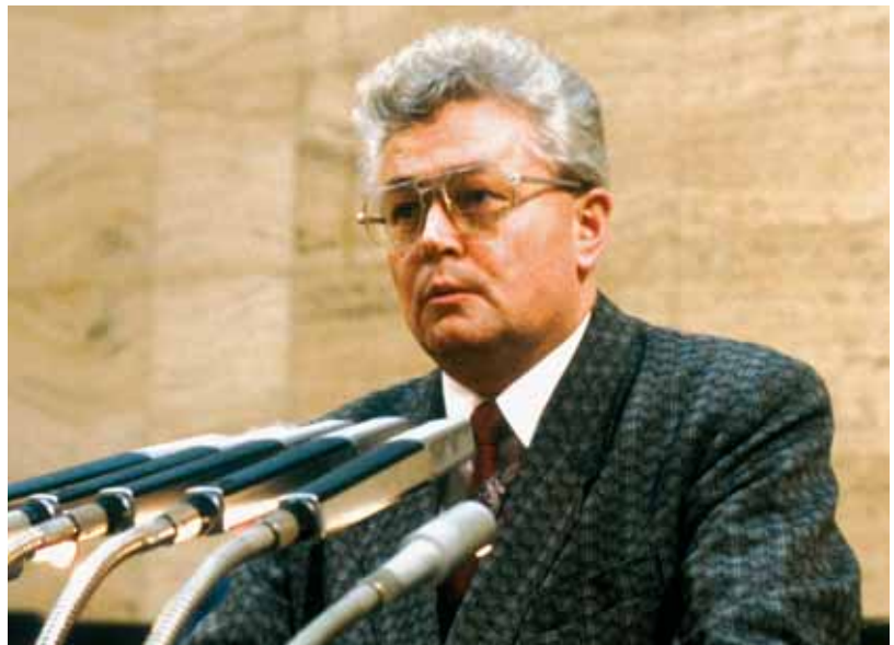
Předseda Československé strany lidové Josef Bartončík.