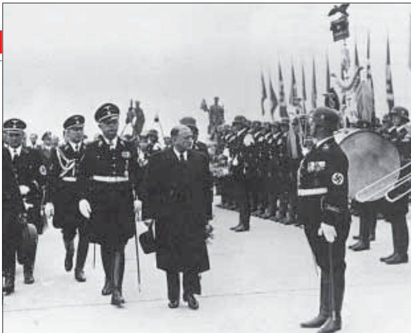
■ Příjezd francouzského premiéra Edouarda Daladiera do Mnichova v září 1938.

Výstavba Maginotovy linie začala v roce 1928. Pět let na to integracionistickou politiku Gustava Stresemanna vystřídal zahraničně politický kurs Adolfa Hitlera. V roce 1935 obnovil povinnou vojenskou službu a připojil Sársko, v roce 1936 napochodoval do průmyslového Porýní. Polské vedení tvořené vojáky naléhavě žádalo Paříž o ozbrojený zásah a když ho nedosáhlo, učinilo z toho definitivní závěr o bezperspektivnosti profrancouzské orientace. V Praze si však, zdá se, nikdo nechtěl připustit, že propagandistický mýtus nedobytného pohraničního opevnění mezitím ve Francii vedl ke vzniku „bunkrové mentality“. Za linií se Francouzi cítili bezpeční; požadavek, aby postoupili a investici v hodnotě tří miliard franků zanechali bez užitku v zázemí představoval riziko, které na sebe žádný politický činitel už nechtěl vzít. Význam geograficky vzdálených spojenců ve srovnání se „záračným“ technickým monumentem chápáným jako nepochybný zdroj bezpečí poklesl téměř k nule.