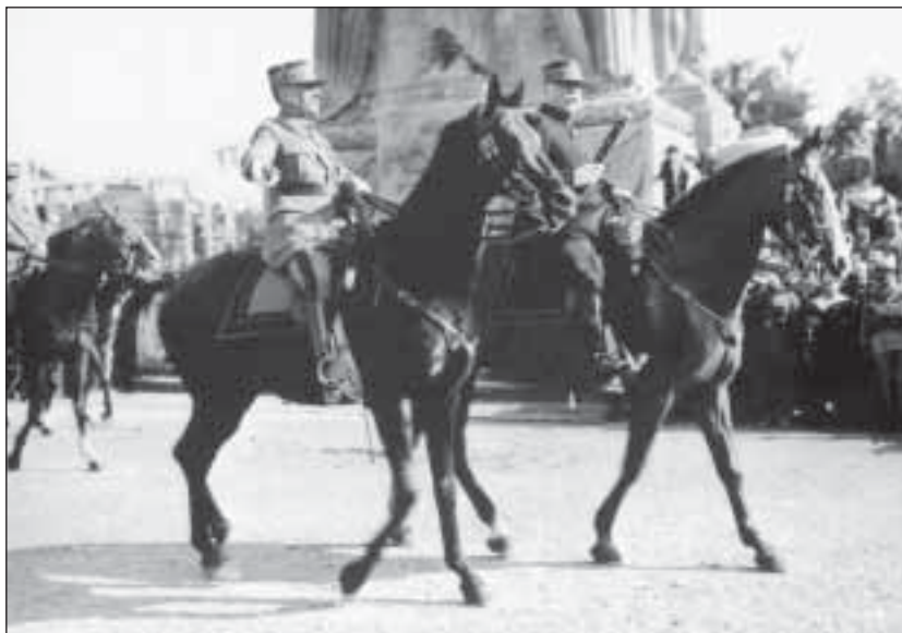
Francouzští maršálové Joffre a Foch, oslavováni veteráni první světové války

s demilitarizací Německa se tedy rychle rozplýval a Francie se právě pro svou dominantní pozici stávala stále izolovanější. Na Paříž se žářilo zejména v Římě, kde měli jistě zcela přirozený pocit, že jejich výkony u Caporetta nedošly náležitého ocenění. Obecně je však třeba říci, že geopolitika zná pravidlo tlaku na obnovení rovnováhy v mezinárodním systému. Všude tam, kde postavení jedné mocnosti je příliš dominantní, objevuje se tendence kolektivně limitovat její akce a odkázat ji do určitých mezí.