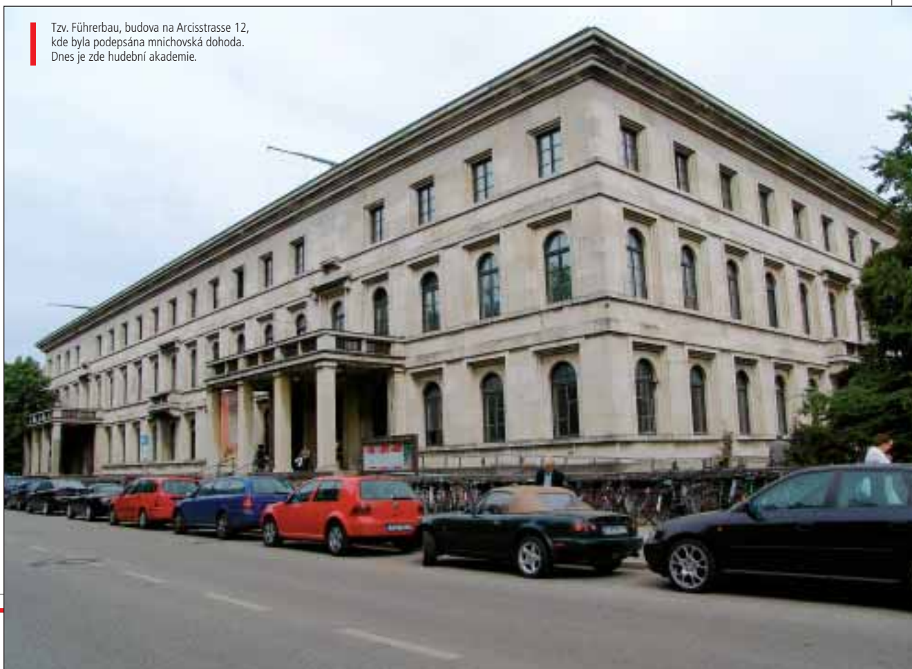
Tzv. Führerbau, budova na Arcisstrasse 12, kde byla podepsána mnichovská dohoda. Dnes je zde hudební akademie.

Pokud mají úvahy o Mnichovu ještě přinést něco, co by nebylo již mnohokrát vysloveno, je třeba přeložit otázku do sféry mezinárodních vztahů. Armáda první československé republiky přece nevznikla proto, aby samojediná čelila mnohem silnější armádě německé – i když právě takové konstelaci musela na podzim roku 1938 nakonec čelit.