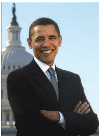
Barack Obama se 20. ledna 2009 stane 44. prezidentem Spojených států.

otevře dveře Iránu. Pro ten je z hlediska národní bezpečnosti primárním cílem podvázání vojenské moci jediného potenciálního rivala v regionu, a ještě raději by v Bagdádu instaloval šiitskou vládu nakloněnou spolupráci. Dokud jsou Američané v Iráku, musí Írán přijmout neutrální vládu sousední země. Jestliže ovšem USA odejdou, Íránu tím rozvážou ruce. Něco takového si nepřejí ani iráčtí sunnitě, ani Kurdové, Saúdové,