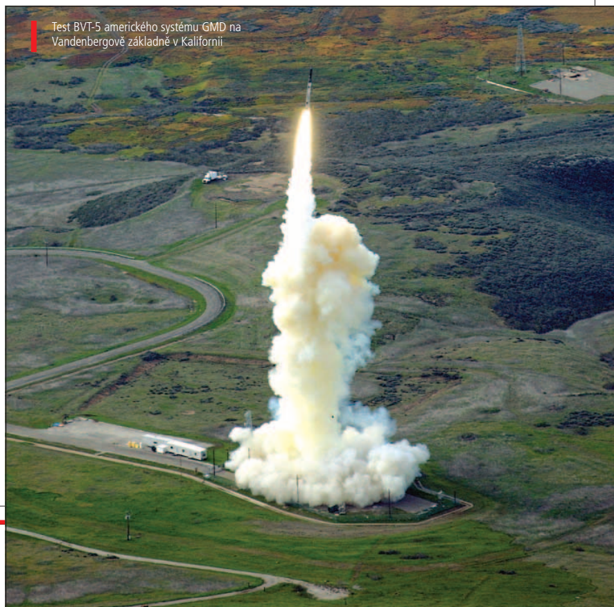
Test BVT-5 amerického systému GMD na Vandenbergově základně v Kalifornii

Rusko bez ukrajinských zdrojů a zbrojního průmyslu může jen těžko aspirovat na návrat k plnohodnotnému statusu velmoci. Jestliže ale Moskva obnoví svůj vliv na Ukrajině, USA ztratí nejdůležitější geopolitický zisk studené války – fatálně oslabené Rusko. Kontrolovat postup Kremlu v mezinárodních záležitostech pak bude mnohem těžší než dosud, dokonce i kdyby evropská aliance začala znova fungovat. Obama však v důsledku dědictví po Bushovi nemá prakticky šanci návratu Rusů na Ukrajinu zabránit.