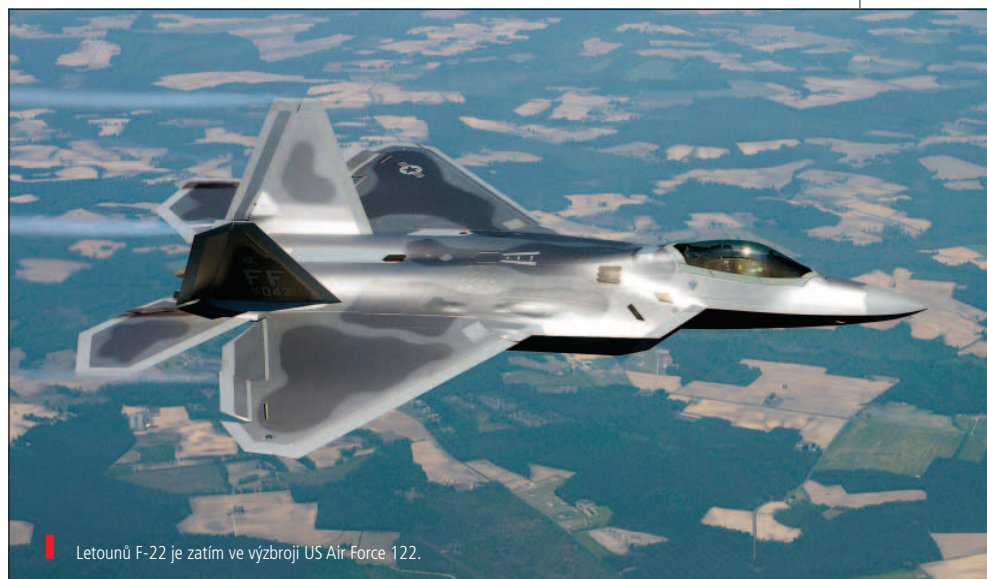
Letoun F-22 je zatím ve výzbroji US Air Force 122.