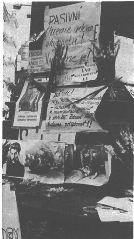
Flakáty - Jungmanův pomník