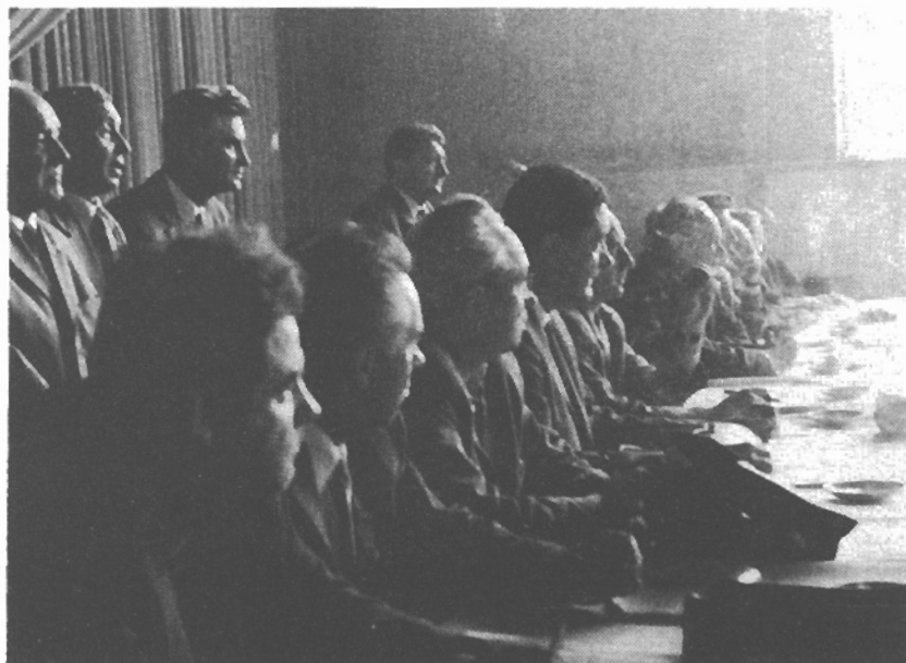
- Z jednání XIV. mimořádného sjezdu KSČ