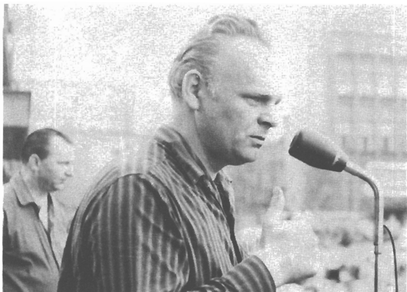
Z jednání XIV. mimořádného sjezdu KSČ