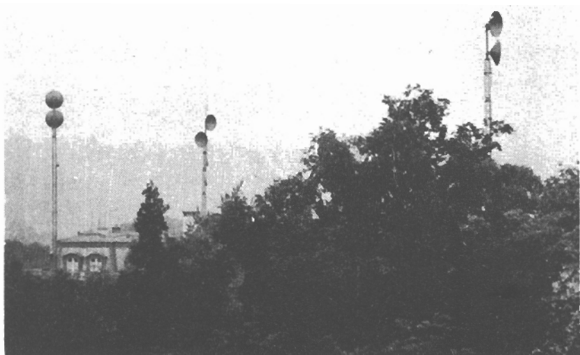
Televizní antény u sovětského velvyslanectví