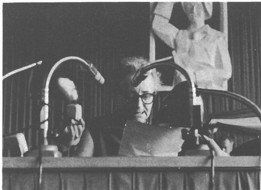
- Jednání XIV. mimořádného sjezdu KSČ