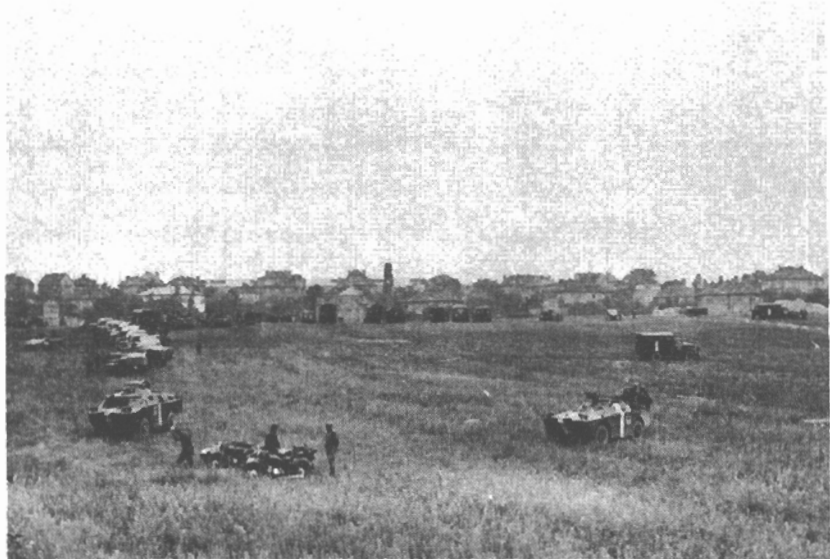
V polích před vlnhradským hřbitovem