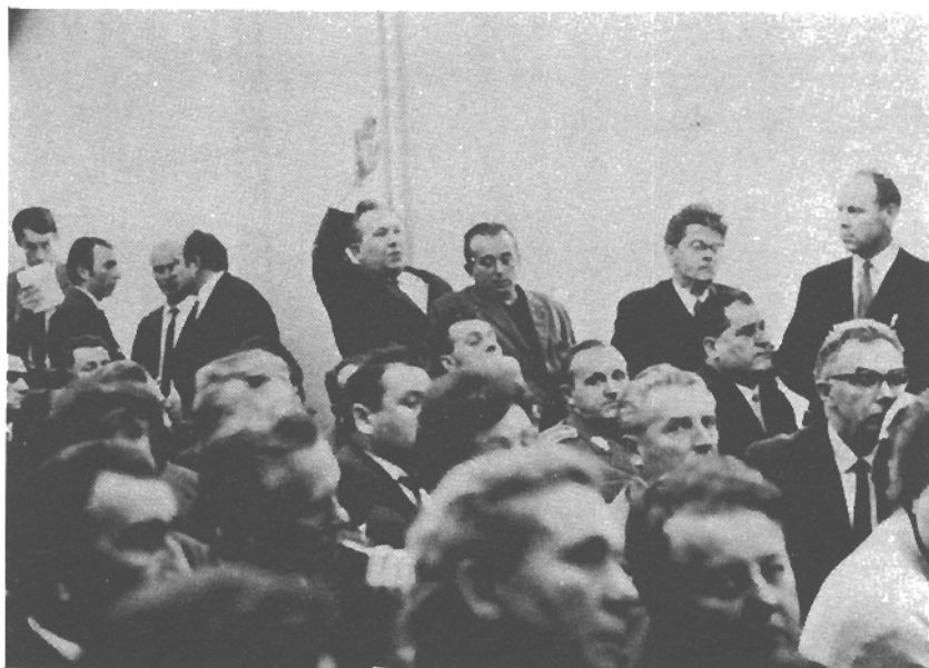
Z jednání pléna NS 22.8.1968