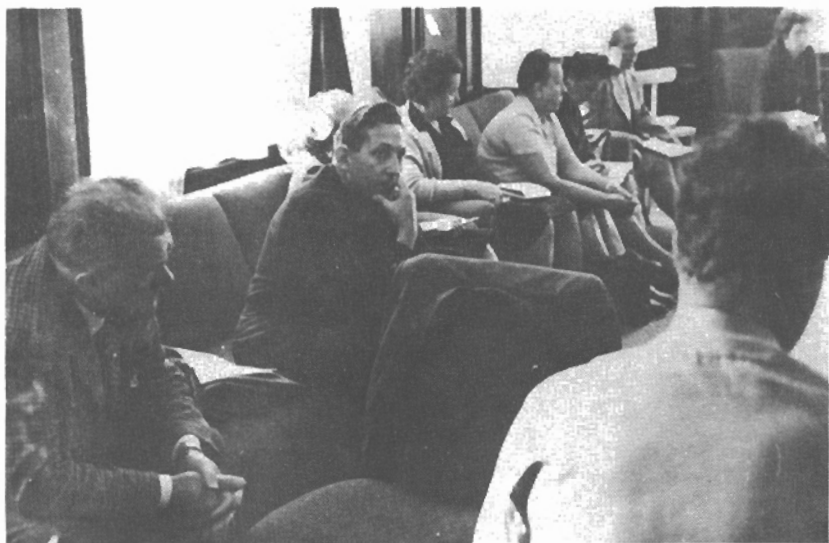
Jednání kulturního výboru NS 22.8.1968