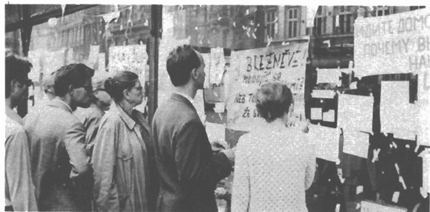
Flakáty - Dětský dům