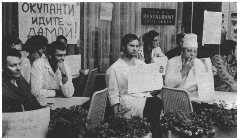
Stávka 23.8.1968 od 12.00 - 13.00 hod. - před hotelem Jalta