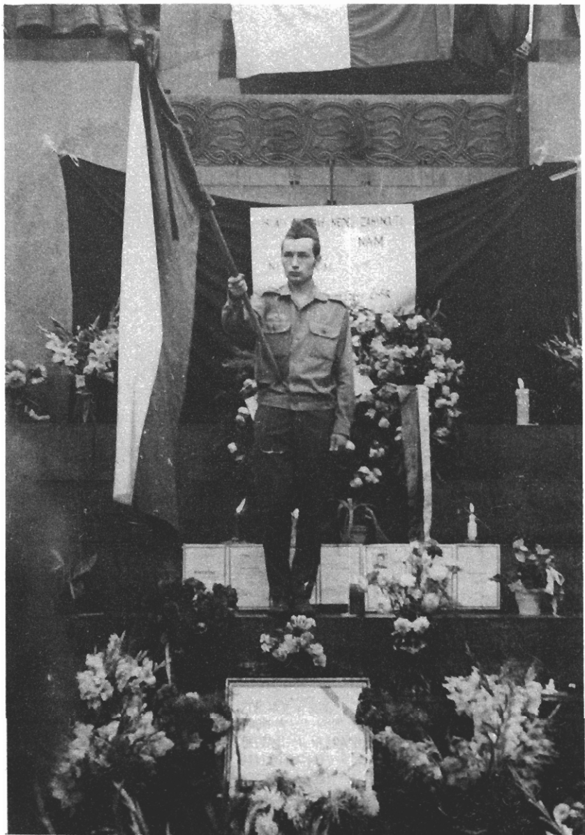
Pocta padlým (Václavské náměstí 31.8.1968)