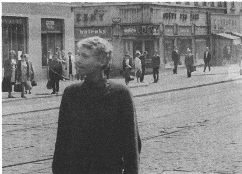
Stávka 23.8.1968 od 12.00 - 13.00 hod. - Nádražní ulice na Smíchově