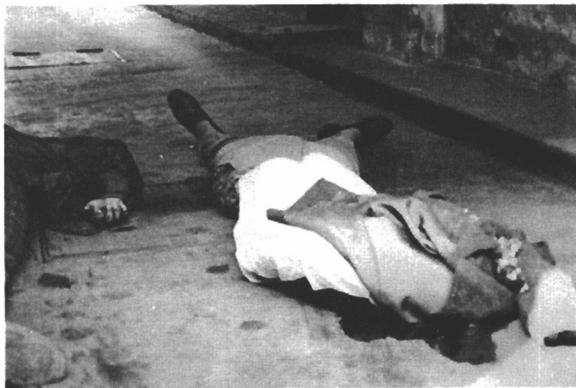
Renění a mrtví /U čs. Rozhlasu/