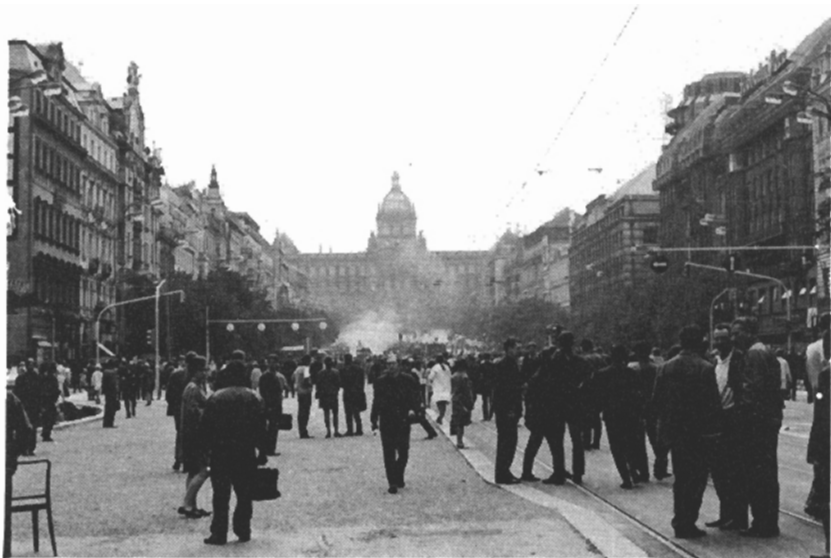
Václavské náměstí - před stávkou