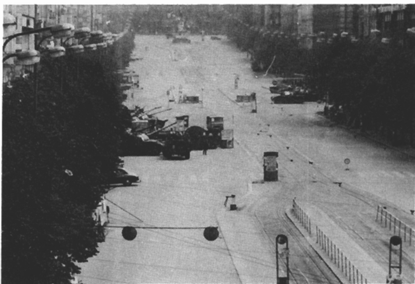
Václavské náměstí - během stávky