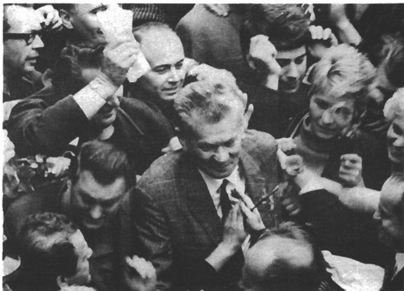
J. Smrkovský - příjezd k parlamentu 27.8.1968