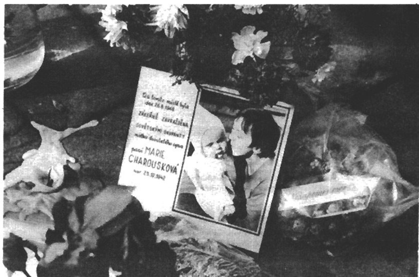
Památník na Klárově