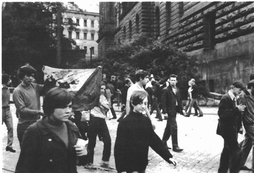
Renění a mrtví (Vinohradská třída)