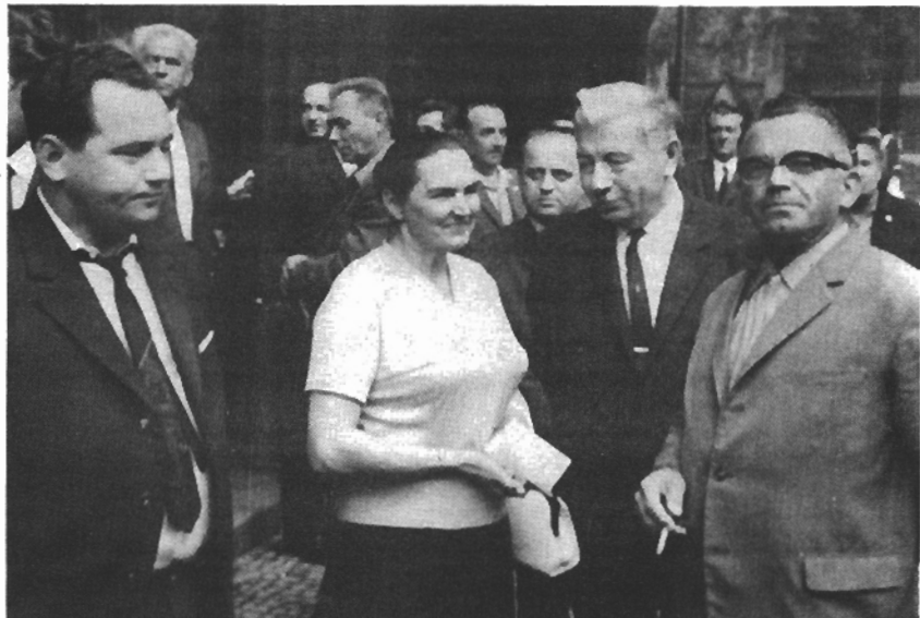
3. 28.8.1968 před kanceláří Národního shromáždění